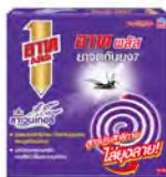
アースプラス 蚊取り線香 ラベンダー